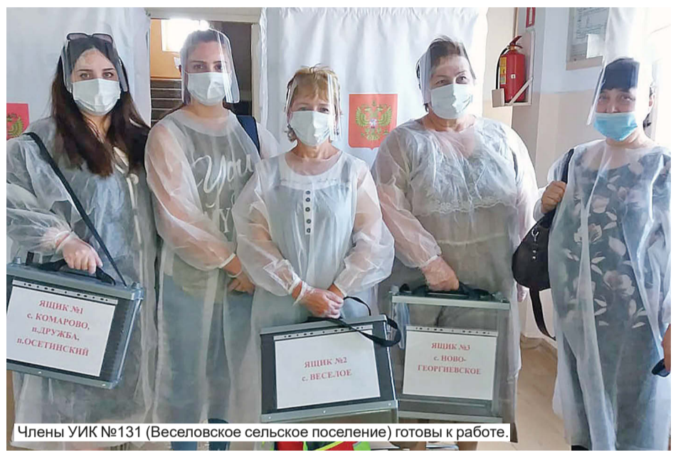
Члены УИК №131 (Веселовское сельское поселение) готовы к работе.

«Подбираемся к 60%», – сказал председатель ТИК, добавив при этом, что повсюду соблюдается порядок, люди понимают важность задачи и выполняют свой гражданский долг без всяких эксцессов. На каждом участке избирательная комиссия работает с 8 до 20 часов, присутствуют наблюдатели. Во все дни голосования особое внимание уделяется пожилым гражданам – старше 65 лет. Избиратели проинформированы о том, что могут прийти на участки в удобное для них время и в спокойной, доброжелательной обстановке выразить своё мнение по поводу поправок.