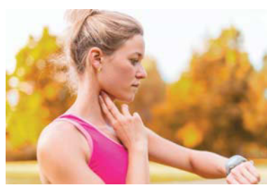
При сильной усталости темп упражнений стоит уменьшить. Совсем прекратить занятия необходимо при проявлениях недомогания.

Если пульсометра под рукой не оказалось, то ориентироваться можно просто по своему самочувствию.